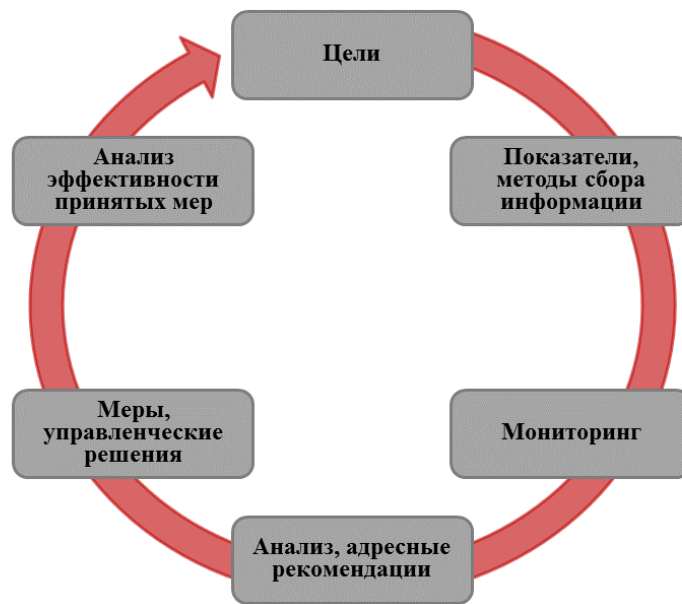
Рисунок 3 – Структура управленческого цикла

Реализация первых двух компонентов возможна через разработку регионами концептуальных документов (программ). Последующие четыре компонента реализуются через принятые регионами подходы (действия).