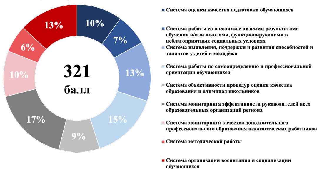
Рисунок 2 – Структура итогового балла

1.8. Максимальный итоговый балл по результатам проведения оценки составляет 321 балл. Структура итогового балла представлена на рисунке 2.